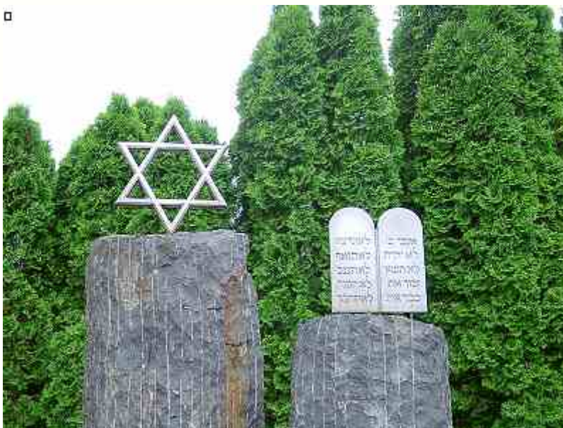
Az emlékü szimbólumai