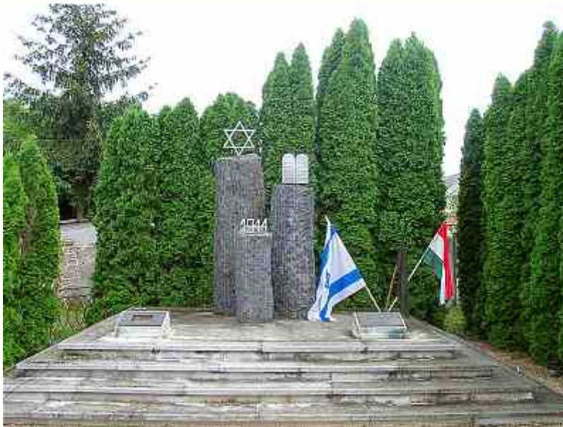
A pápai zsidó mártírok emlékműve

Pár esztendővel ezelőtt alkalmam volt megtekinteni Pápa egyik legszebb, s némi túlzással talán azt is mondhatnám, Európa architektúra-művészetének egyik legszebb épületét. A romjaiban is lenyűgözően varázslatos pápai zsinagógát az 1840-es évek közepén avatta fel a morvaországi születésű, de magyarrá lett rabbi Lőw Lipót. Ő azon kevés rabbik egyike, aki Kossuth Lajos hívó szavára 1848-ban a forradalmi hadsereg lelkeseként szolgálta a szabadság ügyét.