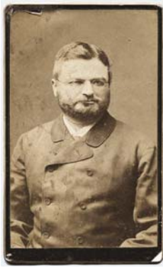
Type image caption here