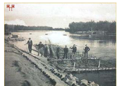
Kirakodás a kotori Hirschler fatelepen