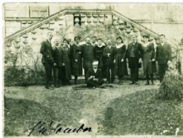
A Hirschler-család és alkalmazottaik