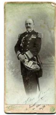
Viktor Baselli báró