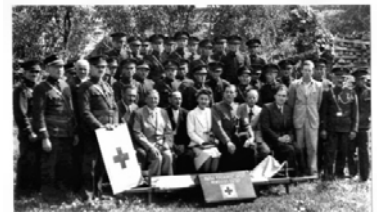
Vöröskeresztes esemény II