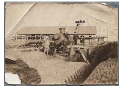
A katori fűrésztelep