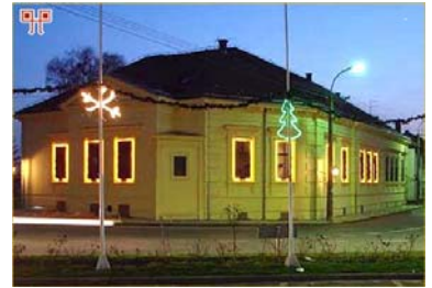
Az egykori Hirschler-ház, ma a domborúi kultúrpalota