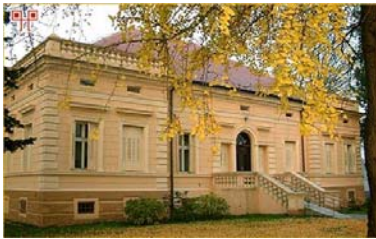
Az egykori Hirschler-palota, ma kórház és rendelőintézet