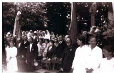
Vöröskeresztes esemény I